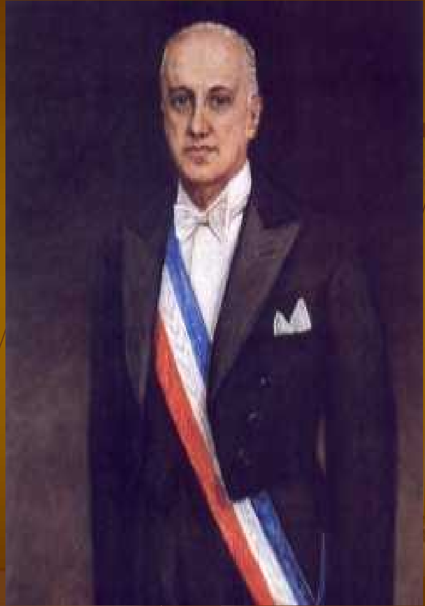
JORGE ALESSANDRI (1958-1964)